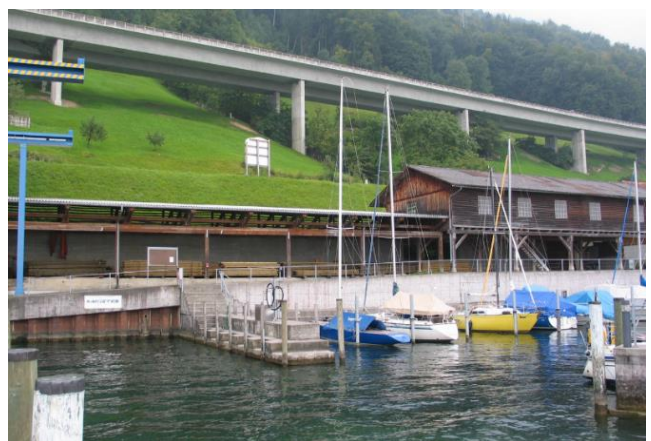
Bootsanlegestellen im neuen Bootshafen