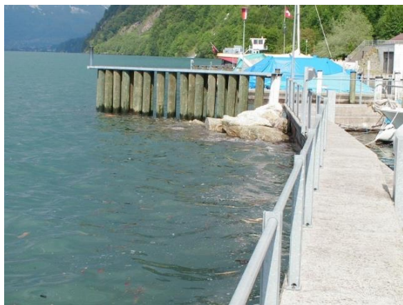
Wellenbrecher und Hauptsteg zu den Bootsplätzen.